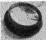
カタログ郵券10円 8枚(誌名記入)