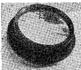
カタログ郵券 10 円 3 枚 (誌名記入)

屈折二枚合成アクロマチック対物レンズ (光軸修正 枠付き) 有効口径 (8cm 以下製作中止) 8cm, 9cm, 10cm, 11.5cm, 15cm, 各口径 f=1:15\sim 1:11 接眼鏡: ラックピニオン二段式 40m/m 接眼鏡兼用 架台: 全周ウオーム式。