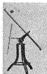
15 cm 経緯台

☆ 8月17日、岡山天体物理観測所に新設される、太陽クーデ望遠鏡の起工式が行われた。