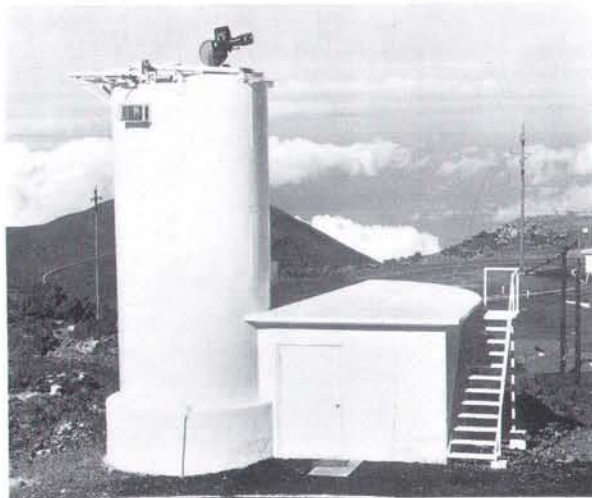
黄道光観測所 塔上の測光器はすべて遠隔操作で動かす。昼間はエレベーターで塔内に納められている。