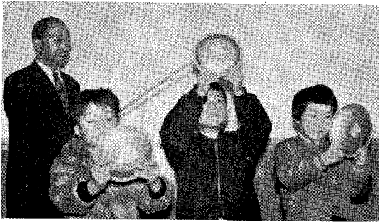
星座早見盤法の解説指示

皆さんこれから星座(星の集まり)を覚えてもらいます。この(星座早見盤, 北天星図)使い方を説明します。これは空にこのごろ見えている星をかいてあるものです。これを(星座早見盤)このように頭の上へ上げて、北とかいてある方を北に、南とかいてある方を南に向けると、空のたいていの星がかかれています。