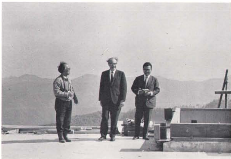
ペーカーナン・シュミットカメラ観測室の屋上にて。左から富田，ホイッブル，古在の各氏。

コスパー総会に出席したアメリカの Smithsonian 天文台長 ホイッブル氏外 4 名は 5 月 16 日 東京天文台堂平観測所を訪れ、最近三鷹から移転した人工衛星観測用のペーカーナン・シュミットカメラをはじめ各種観測器械を見学した。