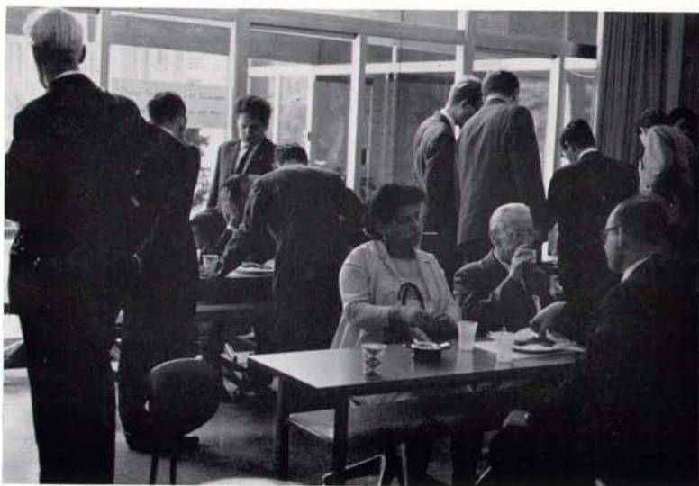
休憩室 (東京天文台講義室) 風景。休憩室には、岡山、乗鞍、堂平、野辺山等の各観測所の写真や、ロケット搭載用観測器を展示した。