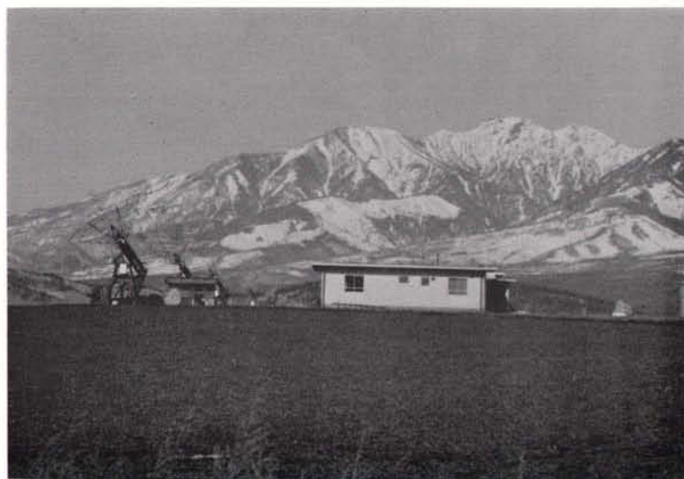
完成したアンテナ群と観測棟 (1969 年 2 月末)