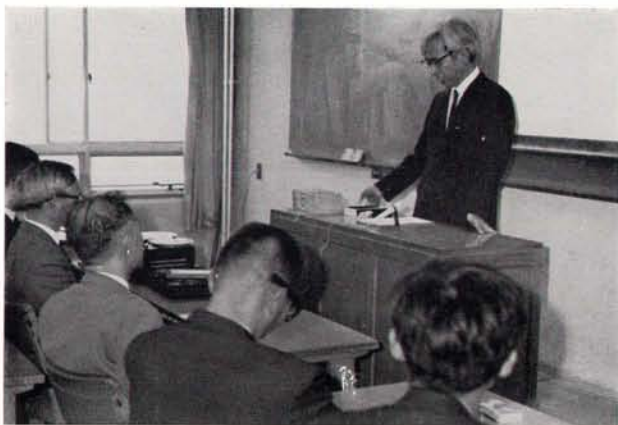
東京大学 藤田良雄教授 3月28日 東大天文学教室 における最終講義