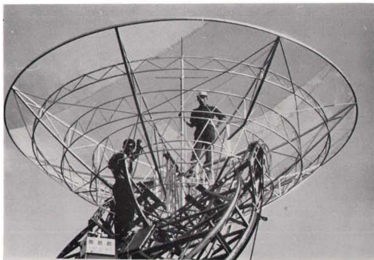
アンテナの電氣的整合作業 (1968 年夏)