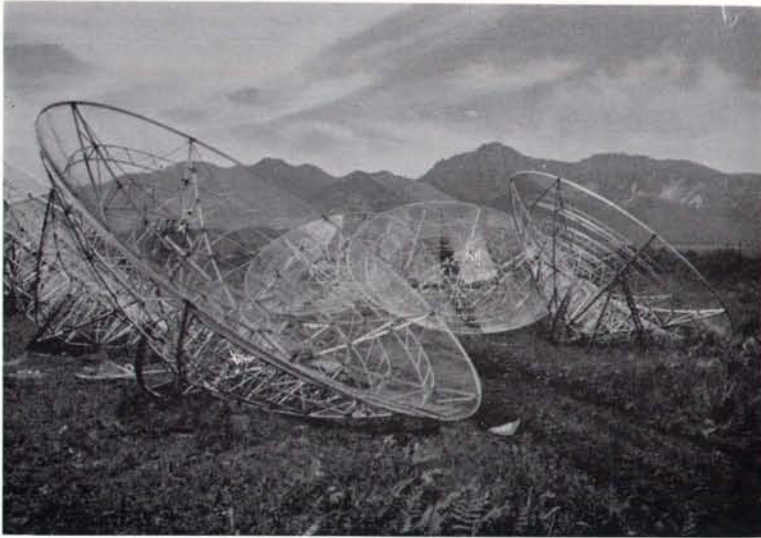
地上での鏡面組立作業 (1968 年初夏)

昭和 45 年 3 月完成を目指して建設中の東京天文台野辺山太陽電波観測所(仮称)の現況である。昭和 44 年 3 月末現在 160MHz 複合干渉計の東西系がほぼ完成し、最終調整中である。全部が完成すると口径 6 m パラボラ 19 基、口径 8 m パラボラ 3 基となる。(天文月報, 1967 年 10 月号の高倉達雄氏の記事参照)