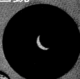
↑ 3月18日の金星 28c/m 反赤75× ASA 100 1/6S