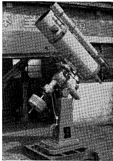
30 cm 反射望遠鏡