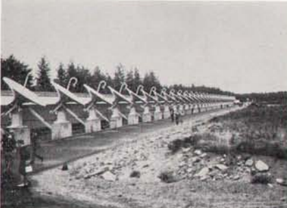
カナダのアルゴンキンにある太陽観測用干渉計.