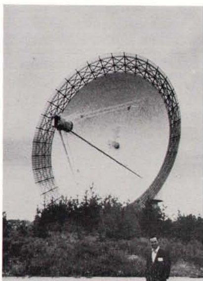
アルゴンキンの45メートル電波望遠鏡.