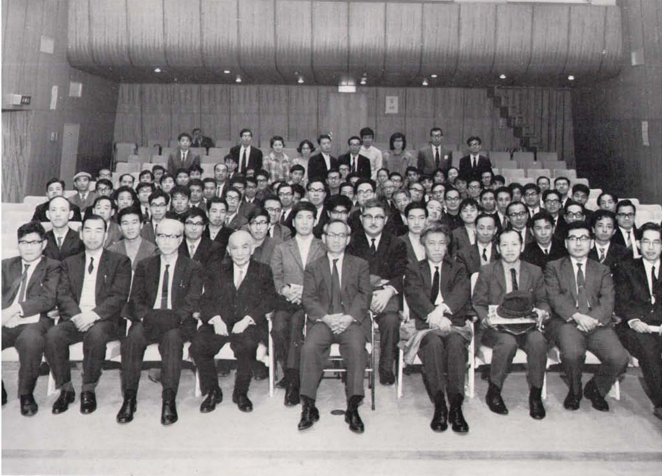
▲秋季年会記念写真