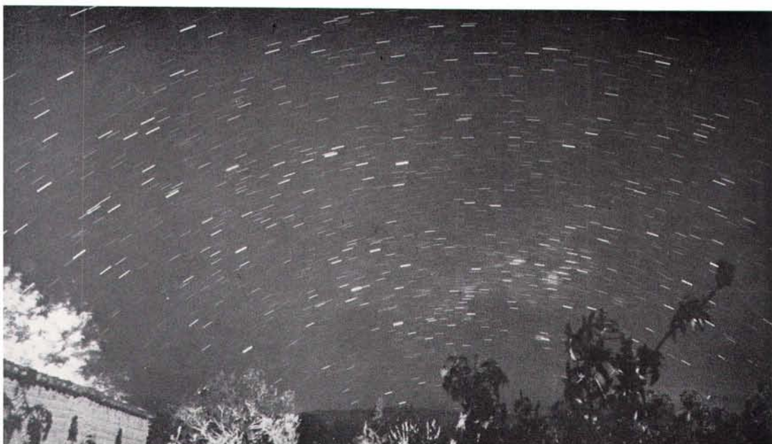
▼皆既日食時の星野写真、南十字星とケンタウルス座の星々がうつっている（5分間露出）。