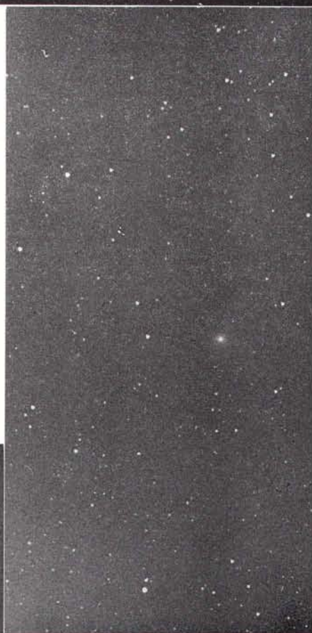
▲ タゴーストウーヤマモト彗星 (1968 a)