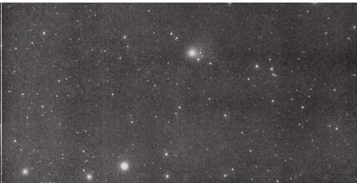
▲ タゴ-サトウ-コサカ彗星 (以上5つの彗星については本誌富田氏記事を御参照下さい) (1969 g)