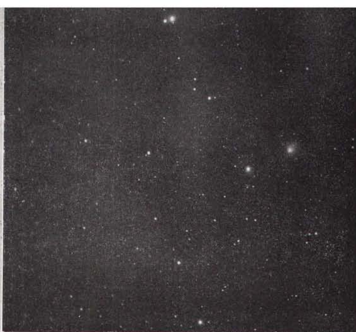
▲ ホンダ彗星 (1968 e)