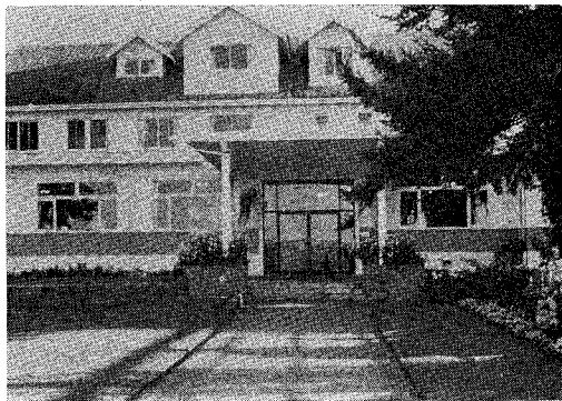
第1図 シンポジウム会場のホテル

の歪みから半分離近接連星におけるガス放出の測光的実証と、放出ガスが主星表面に作る高温スポットの生成について報告された(ワルター)。また、それらガスの運動や、ガス状リングのひろがりについての理論的研究のまとめは、粒子力学的取扱い(スーシューハン)と流体力学的取扱い(北村)に分けて報告された。これらガス流の顕著な分光連星として、R CMa, RZ Sct, U Sge, YY Gem, アルゴール, \beta Lyr, SX Cas, U Cep, SW Cyg, TT Lyr, AT Her が論ぜられた。