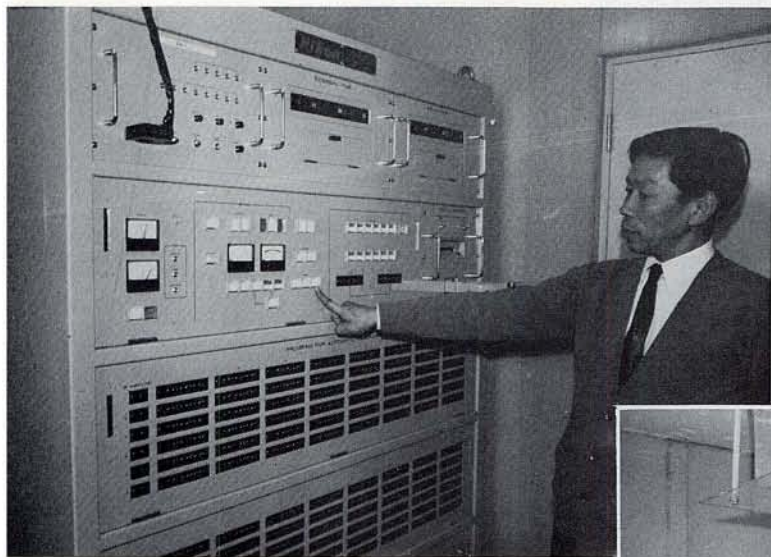
◀ 自 動 観 測 用 制 御 装 置