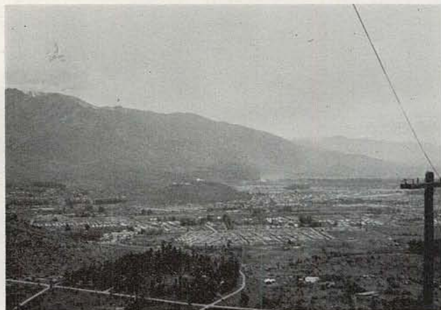
中央の小高い丘が Celo Calan, 天文台がある