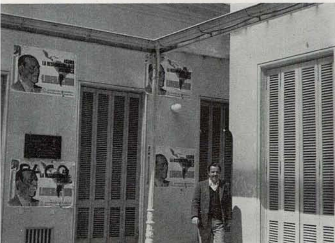
La Plata 天文台内部。大統領選挙直前でペロン候補のはり紙