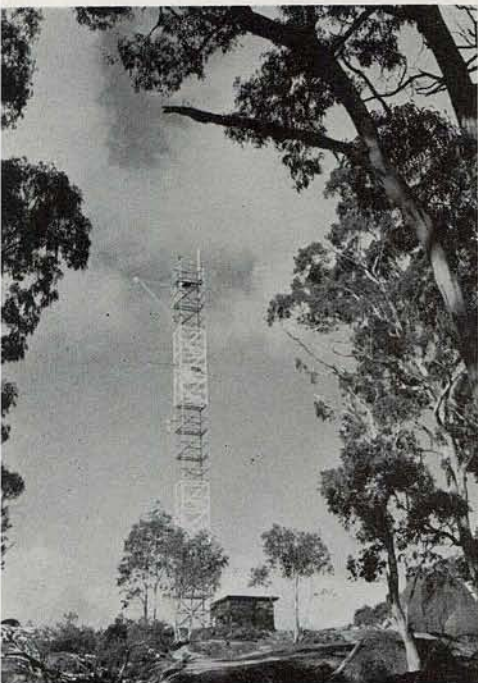
Ororal の LLR 建設予定地