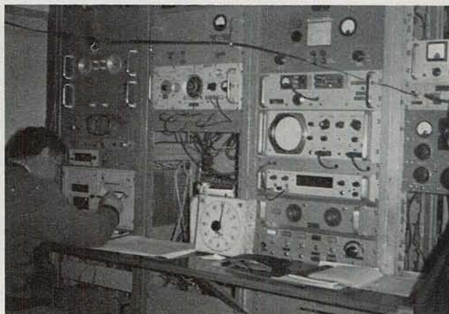
Punta Indio の time equipment と受信機