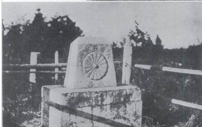
▼ 天測による国境標石 (日本側)