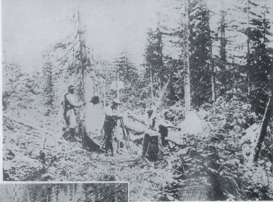
▲ 日本側の作業状況