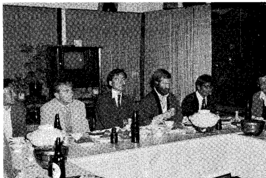
日米セミナー野辺山エクスカージョン風景