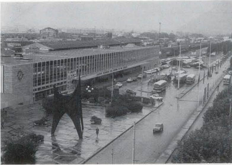
◀ グルノーブル駅。多くの国際会議を迎える町の表玄関にふさわしく、よく整備されている。

▶ グルノーブル大学の総合図書館。会期中はここに受付、郵便局、銀行等が置かれ、各人一日一回はここに入りました。会議場はここから左方に3乃至10分の距離にある。