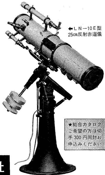
← L N-10 E 型 25cm 反射赤道儀