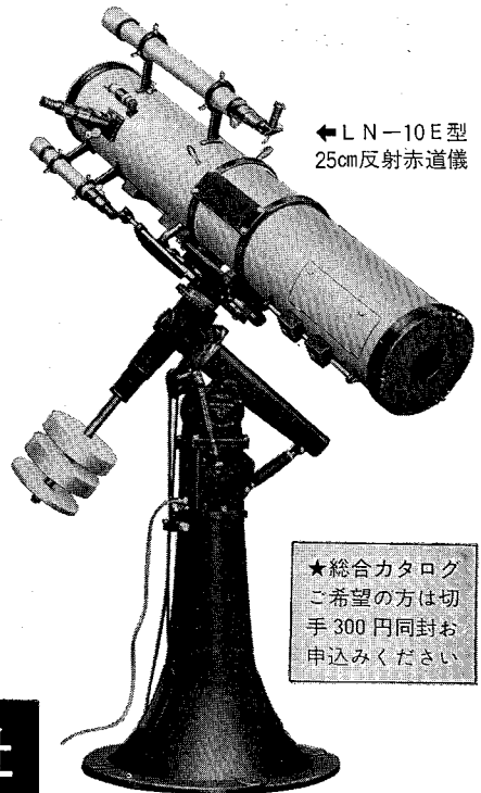
← L N-10 E 型 25cm 反射赤道儀