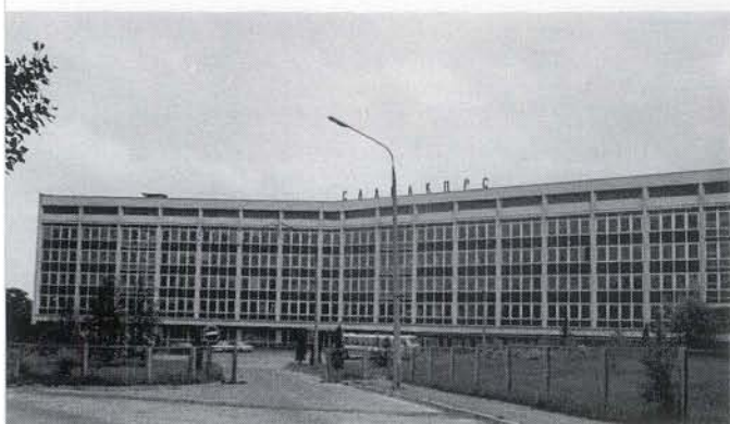
▲ 会場になったウクライナ科学アカデミー所属 理論物理学研究所

1977年5月23日から29日にかけてソビエト連邦 ウクライナ共和国の首都キエフで上記のシンポジウム が開かれた。