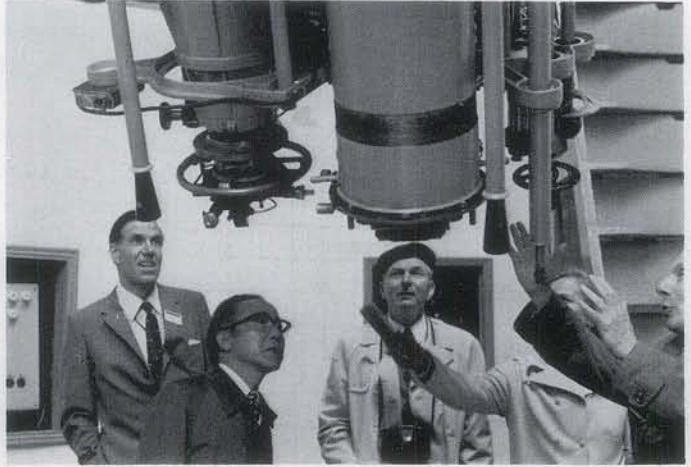
▲ キエフ天文台の口径 40 cm, 焦点距離 550 cm天体写真儀を見学する参加者