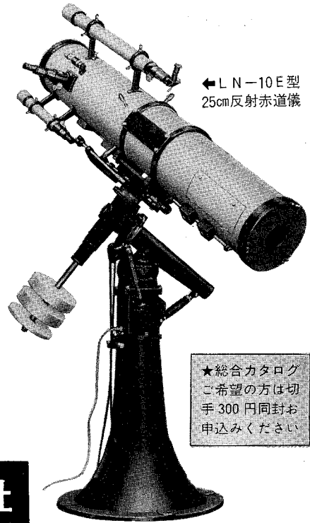
← L N-10 E 型 25cm反射赤道儀