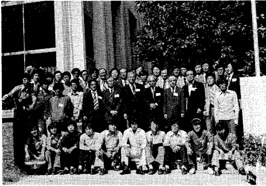
図4 シンポジウム出席者

and Engineering Foundation) の事務総長など、多数の関係者が出席され盛会であった。