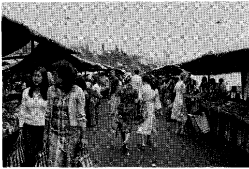
サンパウロ、パカエンブー広場の市場（土曜の朝）

同型の電波望遠鏡を売っている。他には全く見られないユニークな設計として有名なので少し触れておこう。