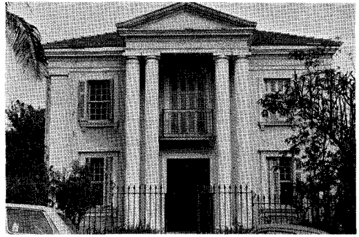
CRAA (M) のたてもの。大きな邸宅を借りて使っている。

に10メートルの望遠鏡 (これが驚異的な面精度を持っているらしい) を作り観測を開始している。更に3台作り干渉計にする計画と聞いている。