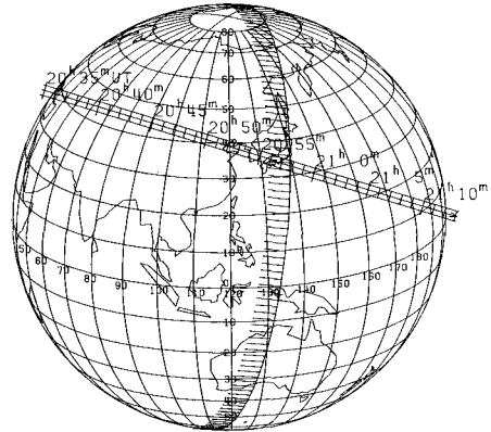
(65) CYBELE (13.2等)による +19°1399 (9.7等)の掩蔽

昨年12月11日に起こった(18) Melpomene (9.2等)による SAO 114159 (7.7等)の掩蔽は、ワシントンD. C., ボルチモアで 9 h 11 m 0~11 m 5 UT に観測され、その