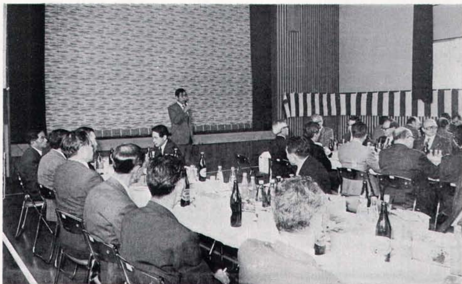
お祝いの言葉を述べる守山東京天文台乗鞍コロナ観測所長(上宝村蔵柱公民館)