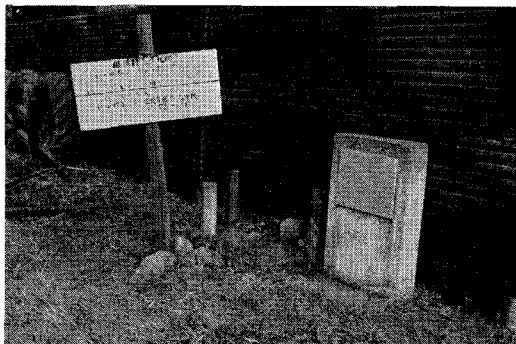
相模野基線北端点のベンチマークと説明文の石碑