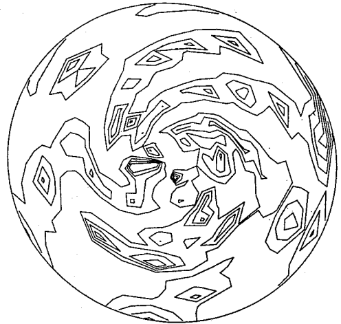
図 11 微分回転する円盤上での Trigger Wave による構造

いる。初期に、微分回転する円盤上の2点に摂動を与え Trigger Wave を引き起こし、ある時刻で HI 雲成分 ( X_0 ) の等高線を描いた。今後、より現実的な銀河モデルへと発展させたい。