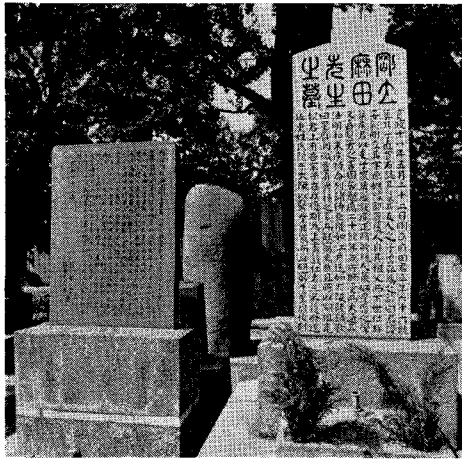
麻田剛立墓・碑 (浄春寺)