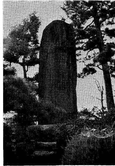
国友一貫斎顕彰碑

なお長浜市には、木下藤吉郎時代の城や豊公園など古社寺も多く、近くの賤ヶ岳古戦場、彦根城など観光にはこと欠かない。 (日本流星研究会 藪 保男)