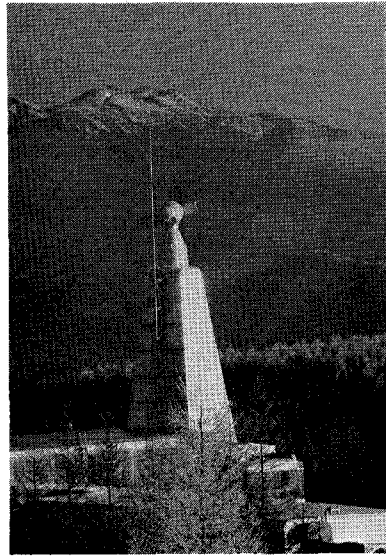
ドームレス太陽望遠鏡。背景は乗鞍岳である。

個人による天文台の見学については、原則としてお断りしている。学校関係など団体による教育研修を目的と