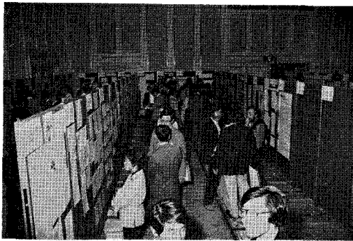
写真4 ポスター会場