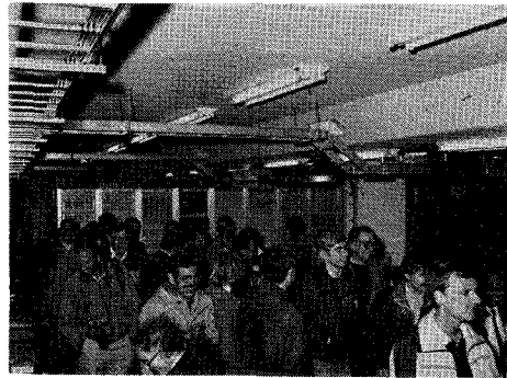
写真5 130人が野辺山宇宙電波観測所を訪れた(13日のエクスカッション)