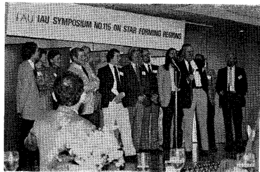
写真6 クロージング・ディナーでお国の歌を披露するカナダからの参加者。