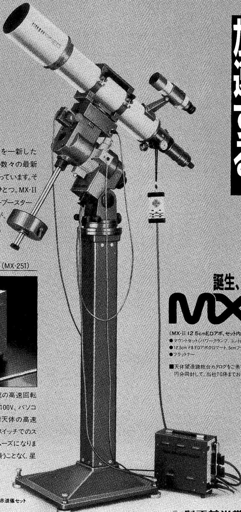
MX-II ED 12.5cm屈折赤道儀セット

赤経80倍速、赤緯130倍速の高速回転を可能にします。電源はAC100V。パソコンによる操作に備えて目標天体の高速導入を可能に。またハンドスイッチでのスローアップ方式もさらにスムーズになります。基本の高精度追尾を損うことなく、星を素速く捉える機能です。