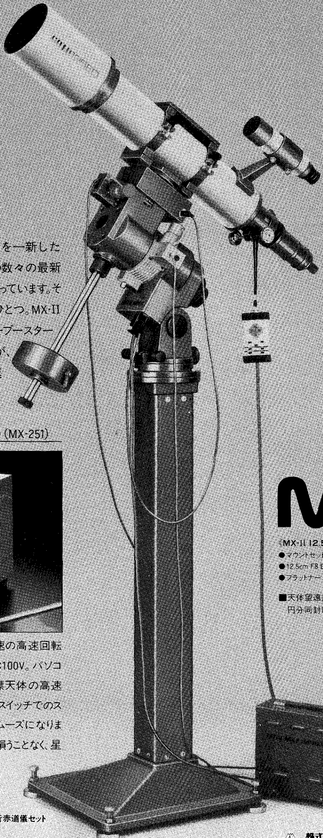
MX-II ED 12.5cm屈折赤道儀セット

赤経80倍速、赤緯130倍速の高速回転を可能にします。電源はAC100V。パソコンによる操作に備えて目標天体の高速導入を可能に。またハンドスイッチでのスローアップ方式もさらにスムーズになります。基本の高精度追尾を損うことなく、星を素速く捉える機能です。