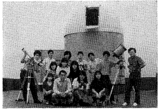
写真2 新装なったドーム(?)の前で天文研究会のメンバーとともに

学生達には申し訳ないような上記観測機器の貧弱さにたいし、特に卒論関係で利用する計算機類の設備は分校として年々充実されている。この点では私もかなり貢献しているわけです。昔は、今ではパソコンの機能にも及ばない、Hitac-10 というミニコン(?)を大事に使っていたものだが、現在は中型汎用機を持つに至った。中型機といっても10年ぐらい前の大型計算機の機能に匹敵するのであるから、本当にコンピュータ業界の進展はすごいものだ。もちろんCPUでは現在の大型計算機に比較すべくもないが、ある程度の計算は可能、図形処理も可能、そしていくら使っても無料であることが何よりもありがたい。またこのシステムはバケット交換網を通して、大学間コンピュータネットワーク(N-1)に加入(但しユーザ機能のみ)しており、どこの全国共同利用の大