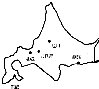
図 1 散在する北海道教育大学の 5 分校

この大学で天文関係のスタッフは旭川分校 1 名(長谷川俊男氏)そして函館の私の 2 名で、いずれも地学科に所属している。小中学校における天文教育の重要性を考え、その小中学校の教員養成を主たる目的としている当大学を考えると、この天文スタッフの数はまったく少ないものである。それゆえ今までのこのシリーズで述べられてきた複数天文スタッフを有する他の教育大によるレポートとはかなり異なった諸条件をまず強調しなければならぬ。そこでここでは函館分校の事情にのみ限定