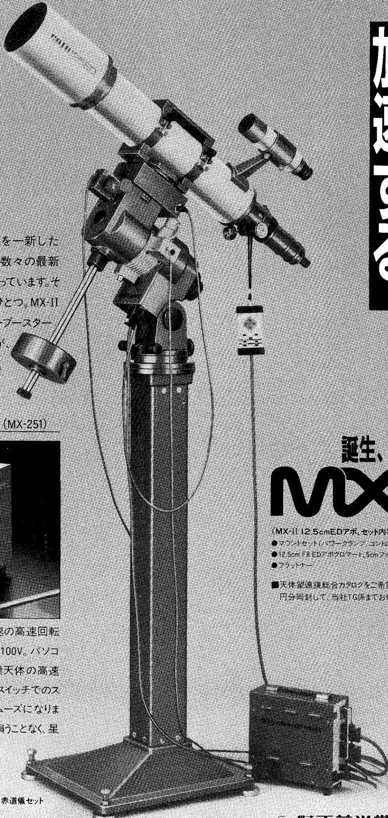
MX-II ED 12.5cm屈折赤道儀セット

赤経80倍速、赤緯130倍速の高速回転を可能にします。電源はAC100V。パソコンによる操作に備えて目標天体の高速導入を可能に。またハンドスイッチでのスローアップ方式もさらにスムーズになります。基本の高精度追尾を損うことなく、星を素速く捉える機能です。