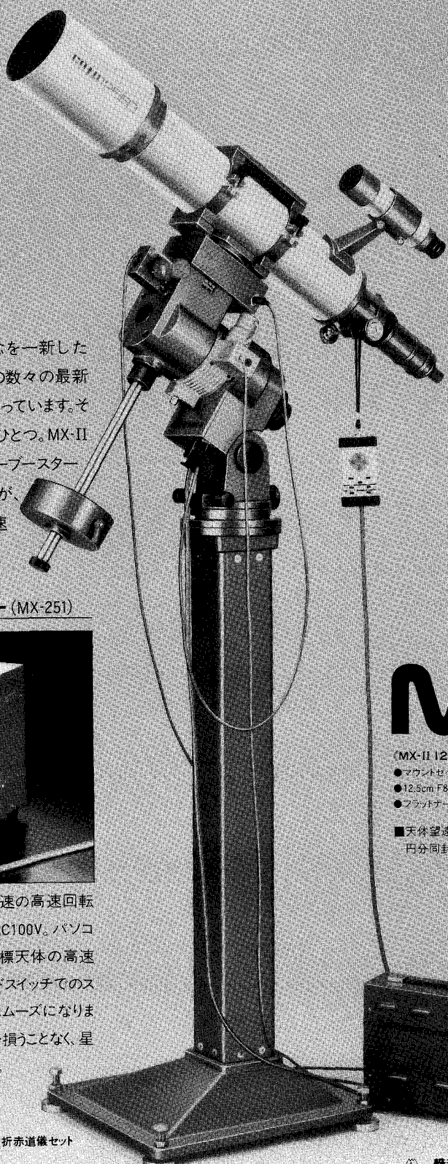
MX-II ED 12.5cm 風折赤道儀セット

赤経80倍速、赤緯130倍速の高速回転を可能にします。電源はAC100V。パソコンによる操作に備えて目標天体の高速導入を可能に。またハンドスイッチでのスローアップ方式もさらにスムーズになります。基本の高精度追尾を損うことなく、星を素速く捉える機能です。