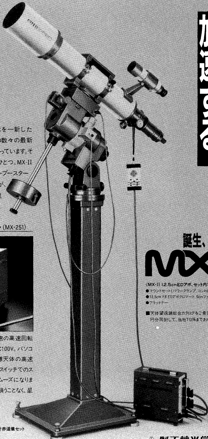
MX-II ED 12.5cm屈折赤道儀セット

赤経80倍速、赤緯130倍速の高速回転を可能にします。電源はAC100V。パソコンによる操作に備えて目標天体の高速導入を可能に。またハンドスイッチでのスローアップ方式もさらにスムーズになります。基本の高精度追尾を損うことなく、星を素速く捉える機能です。