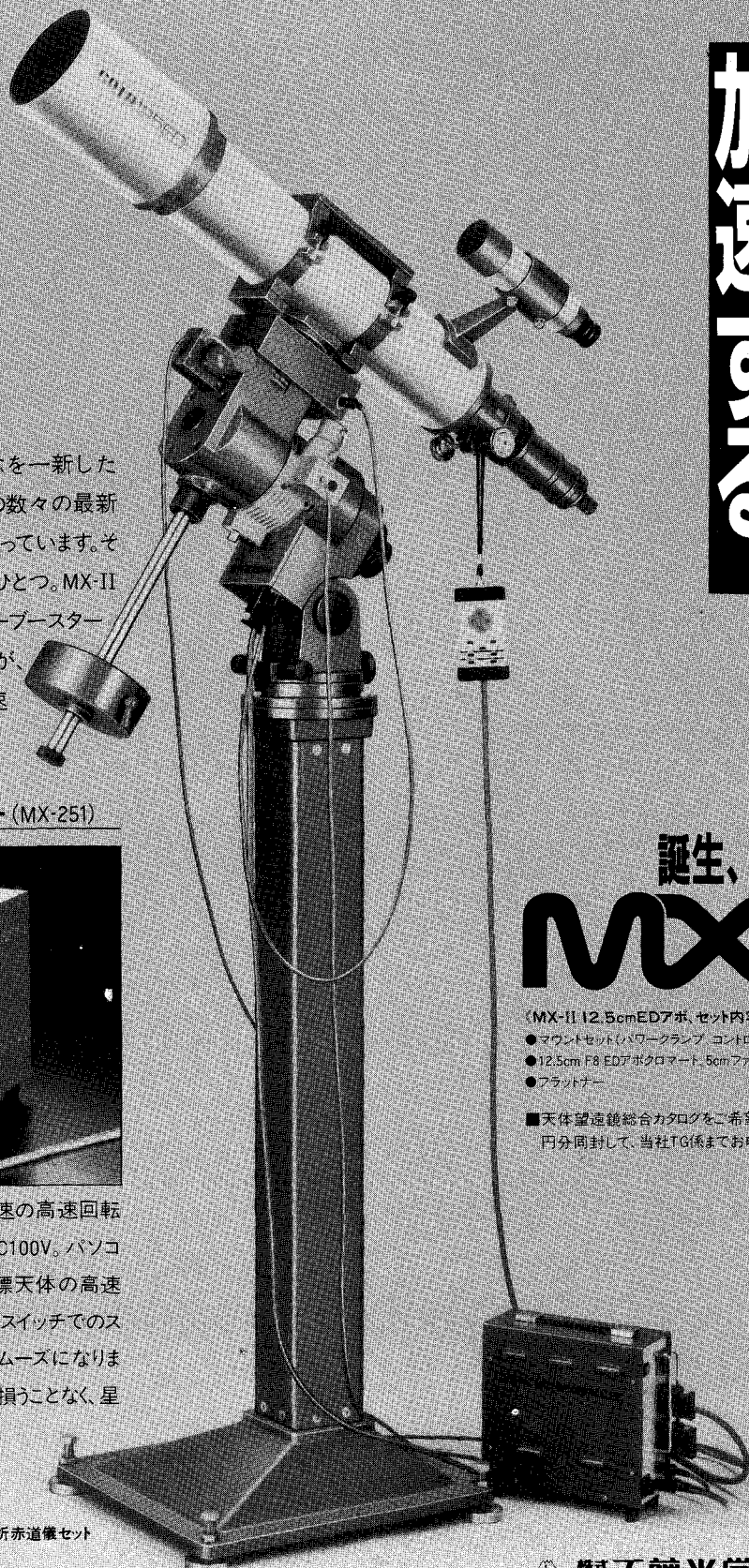
MX-II ED 12.5cm 屈折赤道儀セット

赤経80倍速、赤緯130倍速の高速回転を可能にします。電源はAC100V。パソコンによる操作に備えて目標天体の高速導入を可能に。またハンドスイッチでのスローアップ方式もさらにスムーズになります。基本の高精度追尾を損うことなく、星を素速く捉える機能です。