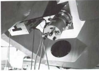
冷却 CCD カメラ