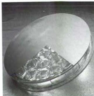
18" diameter, 60% lightweighted mirror blank

低膨張ガラスで、円形、矩形の外、任意の外径形状が可能です。裏面に、ベンチレーション用穴があり、温度変化による、面形状変化が最少になる様に配慮されています。