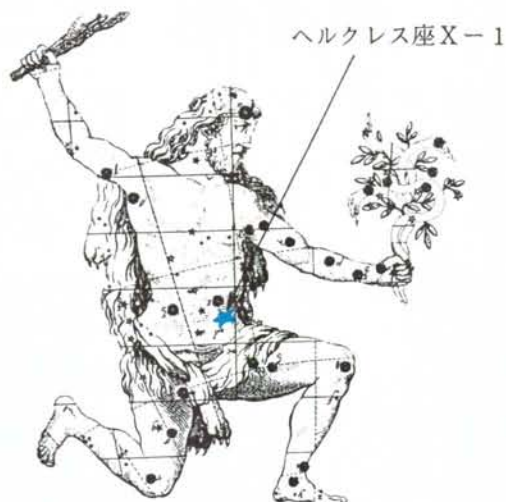
図 1 ヘルクレス座および Hercules X-1

さらにウフルのデータを解析すると，Her X-1 からの X 線が 1.7 日毎に約 2.8 時間消滅する (X 線星食) ことがわかった。また光学観測からその相手の星 HZ Her の光度がやはり 1.7 日周期の