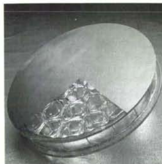
18" diameter, 60% lightweighted mirror blank

低膨張ガラスで、円形、矩形の外、任意の外径形状が可能です。裏面に、ベンチレーション用穴があり、温度変化による、面形状変化が最少になる様に配慮されています。