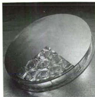
18" diameter, 50% lightweighted mirror blank

低膨張ガラスで、円形、矩形の外、任意の外径形状が可能です。裏面に、ベンチレーション用穴があり、温度変化による、面形状変化が最少になる様に配慮されています。