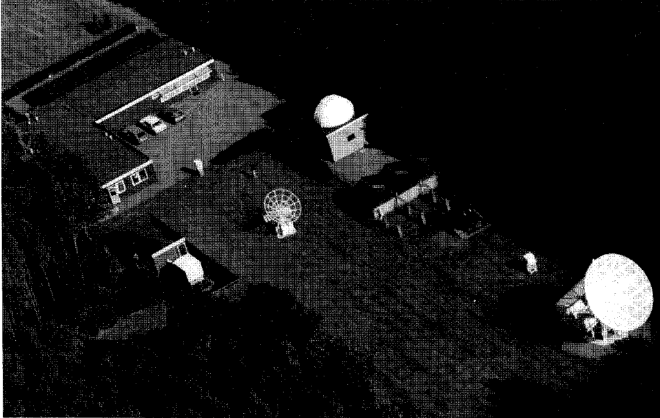
図4 市民天文台シモン・ステーヴィン。左から本館，太陽観測室(白い箱は西村製ヘリオスタットを収納)，ミンナールト観測台(白いドーム)，3棟続きの観測ボックス，右端は7.5mの電波望遠鏡，中央の小電波望遠鏡は今はない。

発見したり、また帆走車を作って人々を驚かせたりした。兵学にもたけ、オランダ独立戦争中の傑人オラーニェ家のマウリッツ (Maurits) 公の師となり、また城砦を築いている。すなわち北欧ルネッサンスの一偉人である。当時の学者が専らラテン語で講義や著作をしていたのに対し、彼は敢えて公衆のためにオランダ語で著述し、最初の自然科学普及者となった。それ故に最初の市民天文台にその名が冠せられたのである。