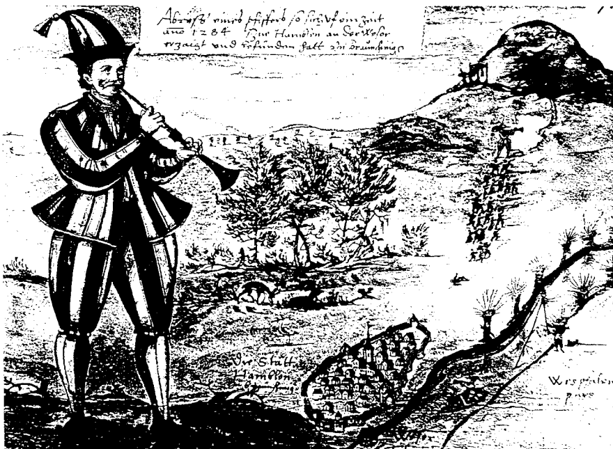
図1 1592年に描かれた、「最古の」ハーメルンの笛吹き男の絵

ここで注意すべきことは、グリム兄弟は伝説集を編むに当たって、それまでに出版された伝説についての出版物を参考にしている、という点である。実際に彼らの伝説集には、まるで学術論文のように文献リストまで付いている。この伝説の場合、兄弟の引用した文献は、17世紀から18世紀にかけてドイツ各地で出版された、ドイツ伝説に関する比較的新しい著作である。しかしこの伝説についての記述はもっと以前からあり、それを読むと我々は一つの奇妙な事実に直面するのである。その文献の一つに、20世紀になって発見されたリュネブルク手稿本があるが、事件の起こった約200年後に当たる、1430~1450年に書かれたこの本では、驚くべきことに伝説の前半の重要なモチーフである鼠男については全く記述が無く、いきなり1284年6月24日のヨハネとパウロの祭日に奇妙な服を着た男が現れ、笛を吹いて子供達を連れ去ったという、後半の部分から始まっている。