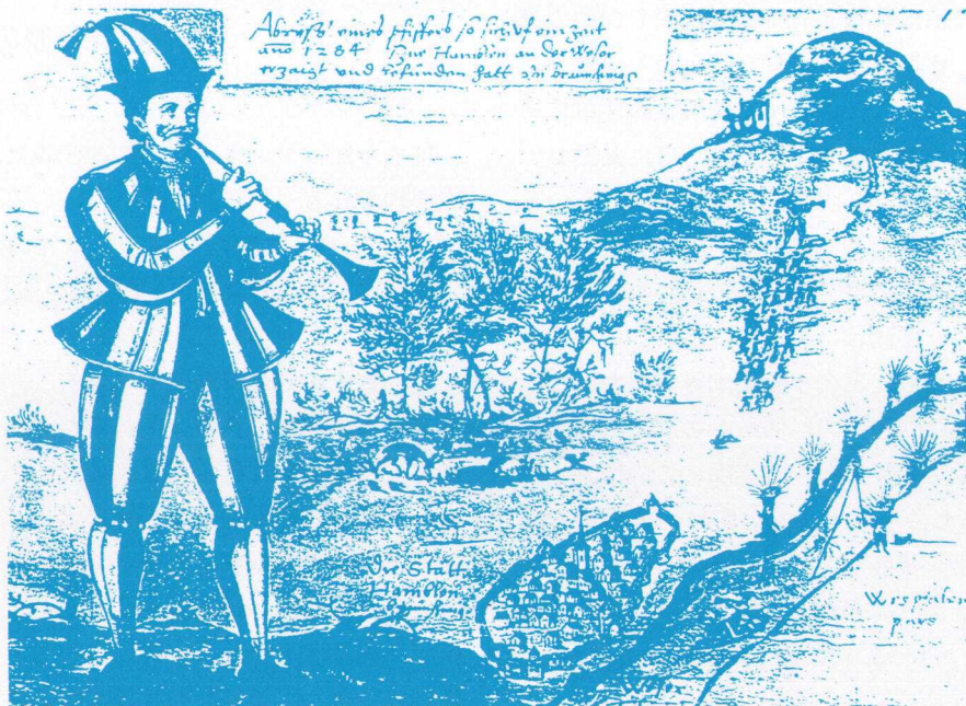
図1 1592年に描かれた、「最古の」ハーメルンの笛吹き男の絵

ここで注意すべきことは、グリム兄弟は伝説集を編むに当たって、それまでに出版された伝説についての出版物を参考にしている、という点である。実際に彼らの伝説集には、まるで学術論文のように文献リストまで付いている。この伝説の場合、兄弟の引用した文献は、17世紀から18世紀にかけてドイツ各地で出版された、ドイツ伝説に関する比較的新しい著作である。しかしこの伝説についての記述はもっと以前からあり、それを読むと我々は一つの奇妙な事実に直面するのである。その文献の一つに、20世紀になって発見されたリュネブルク手稿本があるが、事件の起こった約200年後に当たる、1430~1450年に書かれたこの本では、驚くべきことに伝説の前半の重要なモチーフである鼠男については全く記述が無く、いきなり1284年6月24日のヨハネとパウロの祭日に奇妙な服を着た男が現れ、笛を吹いて子供達を連れ去ったという、後半の部分から始まっている。