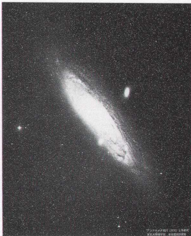
図 1 アンドロメダ銀河 M31

M 31 は視直径 180 分角×60 分角の広がりを持つ Sb 型の渦巻銀河である。中性水素雲や分子雲はドーナツ状に分布していて中心部では希薄になっている。ガス円盤は外縁部で最大 4 kpc ほども銀河面からめくれ上がっている。中性水素原子の 21 cm 輝線の観測から、M 31 の回転速度は外縁部でも減速しないことが確かめられており、「見えな