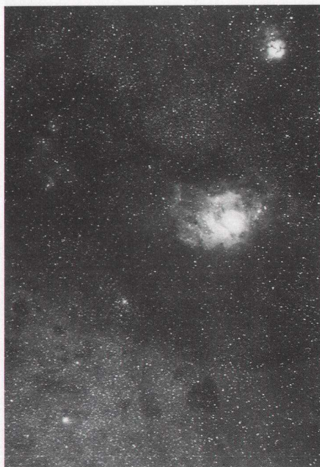
M 8 周辺 ▶ 「遙かなる宇宙へ」より