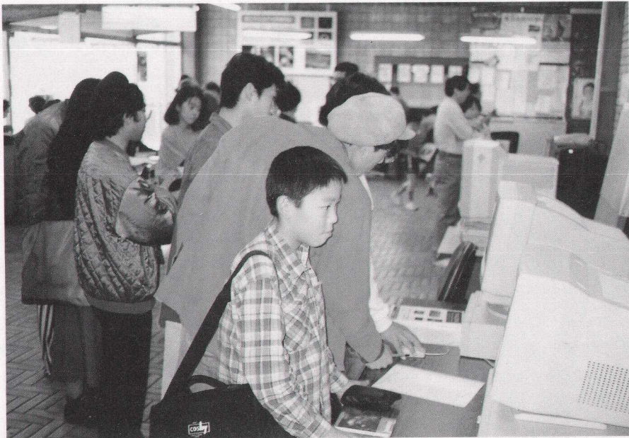
図1 三鷹の公開日で初登場のPAONETブース（1994年11月12日）

天文台の理想像など何も存在していなかった。そんな中で新しい試みである「普及と研究の両立」を目指して西はりま天文台はオープンした。5年たった今、振り返ってみれば、目標とした「両立」の難しさを感じる。これは、目標が間違っているのではなく、ただ単に時間が、いや人が足りないのである。普及活動という言葉を聞くと簡単そうに聞こえるが、相手が多様な「人」だけにとにかく大変である。