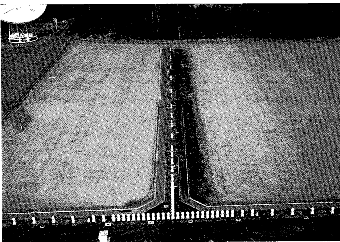
表 1 野辺山電波ヘリオグラフの性能